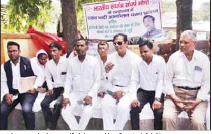
बाबा चौपाल राम अरवि चर्च पर शराब बंदी को लेकर चलाने वाले भारतीय स्वतंत्र सर्वेसर्ग मोर्चा के सदस्य।

शराब लाइसेंस देना बंद न किया तो करेणु आंदोलन, विधान बंद धरेंगे